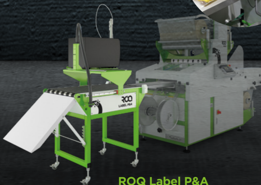
ROQ Label P&A